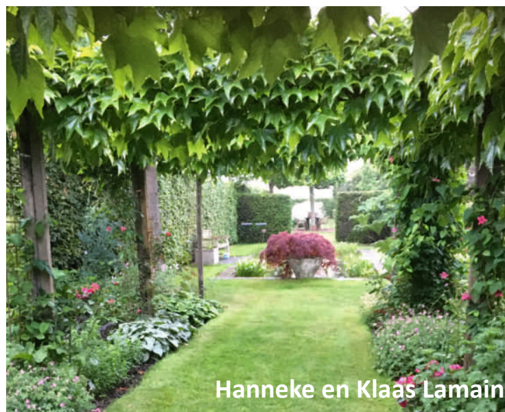
Hanneke en Klaas Lamain

Little garden (550 m2) is een tuin in tropische stijl. Ook zijn er opvallende Japanse elementen. Met mediterrane planten, terrassen en borders. Kleine zwembijver met een verrassend klein landschap, bestaande uit bonsaiplanten. Ons fotoboek is gratis te bezichtigen op ons overdekte terras/tempel.