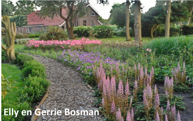
Elly en Gerrie Bosman

Verscholen natuurlijke bostuin van 4000m2 op prachtige plek in Winschoten. Sinds 2019 wordt hier getuinierd en gecreëerd. Een mix van gemengde borders, vijver en kunst is het resultaat.