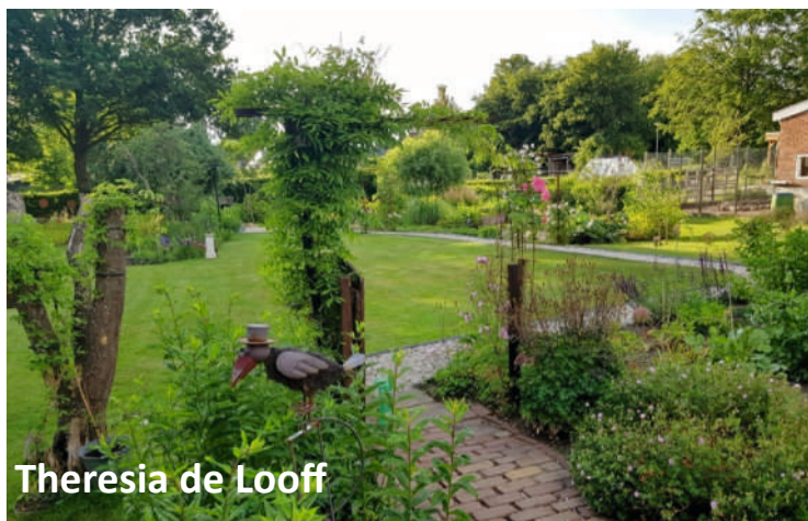
Theresia de Loeff